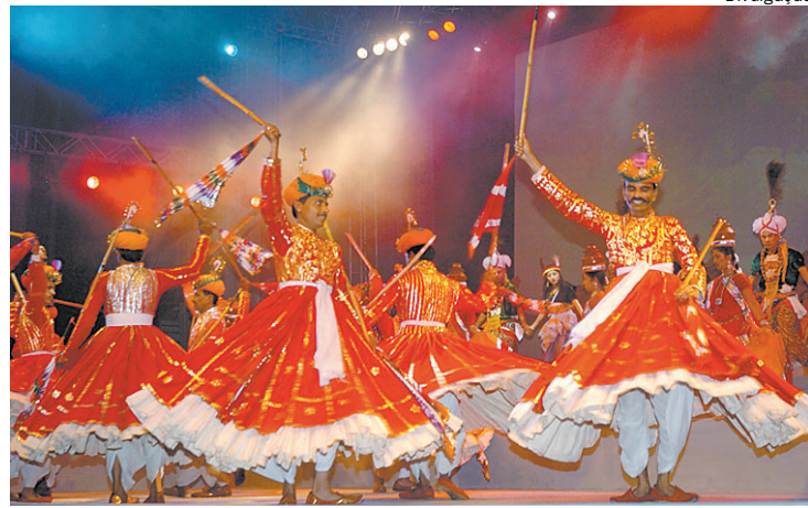
FESTIVAL – O grupo folclórico do Rajasthan dança em Nova Délhi